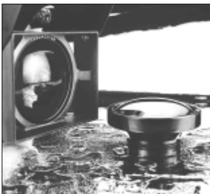
THALACETOR - THALASPHERIC PRO DV