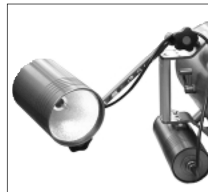
THALALIGHT HID 50 su custodia Mk2000