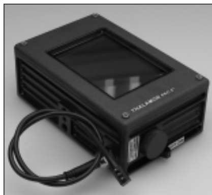
THALAMON PRO 5"