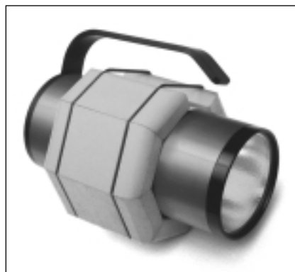
THALAGAL N°2 su faro Thalalight