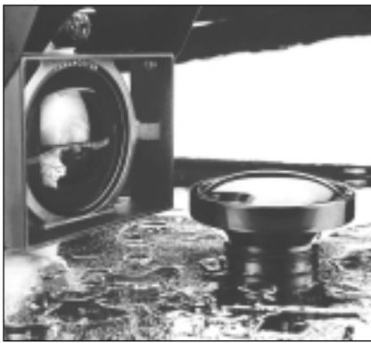
THALACETOR - THALASPHERIC PRO DV