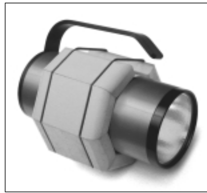
THALAGAL N°2 su faro Thalalight