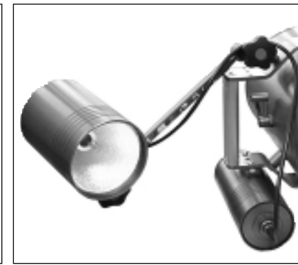
THALALIGHT HID 50 su custodia Mk2000