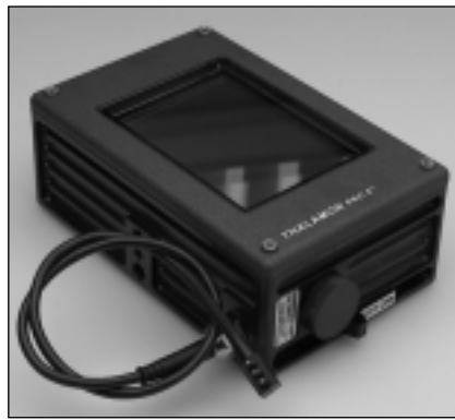
THALAMON PRO 5"